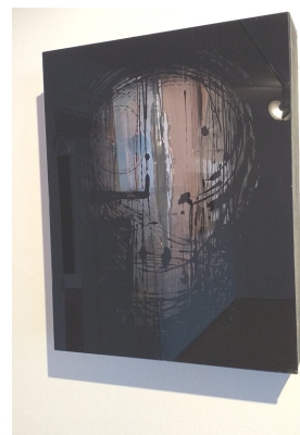
Ladislav Čarný, Černá maska, 1990