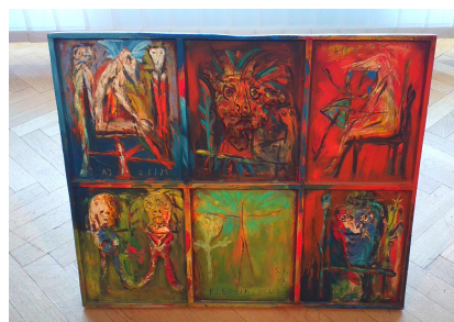
Svetozár Ilavský, Malý Pleonazmus, 1995