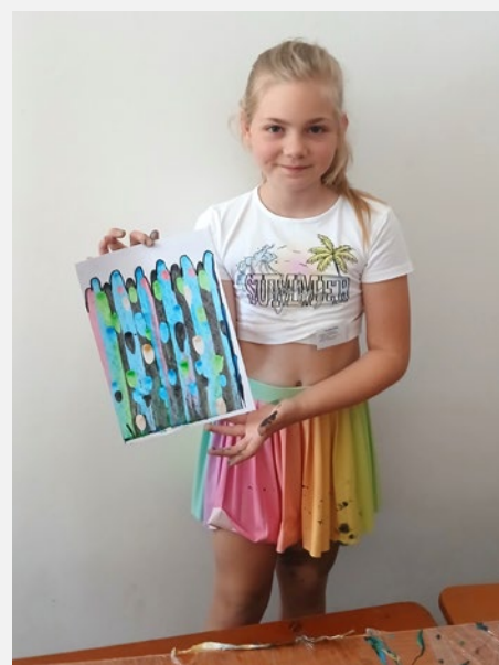
Dětský vědecký festival