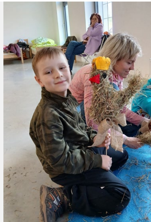
Festivalu umění a kreativity

Léto na Klenové bylo věnováno koncertům – v červenci se uskutečnil Koncert V.V.Ú. a Armero Tragedy a v srpnu Spirituál kvartet .