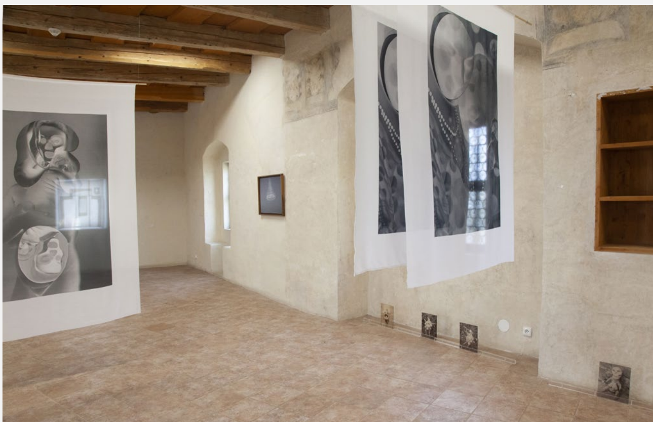
Fátyol Viola, Uncanny Mother, purkrabství hradu Klenová, pohled do instalace