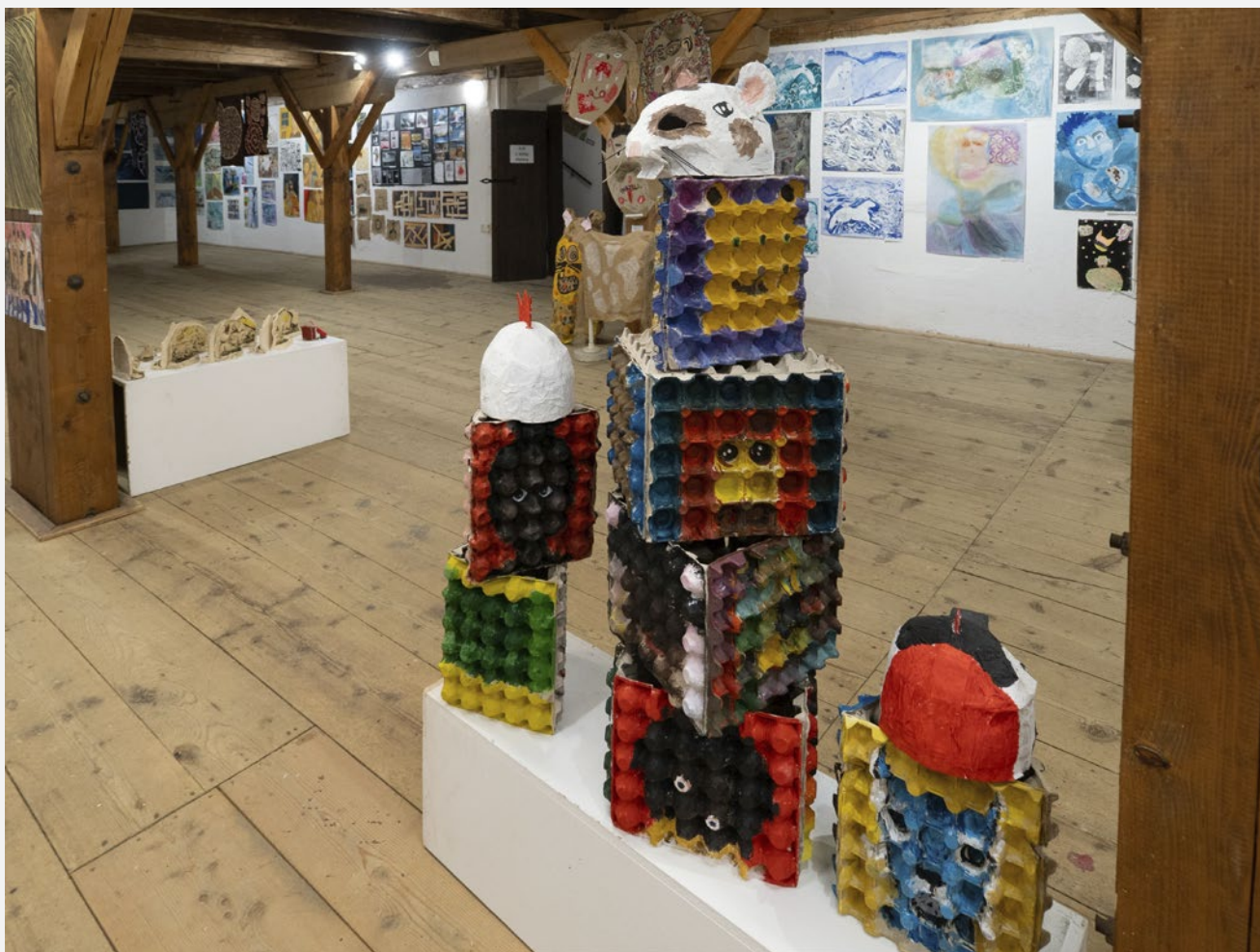
Cesta 2025, pohled do výstavy

Kurátoři výstavy: Jitka Svobodová a Ladislav Sýkora