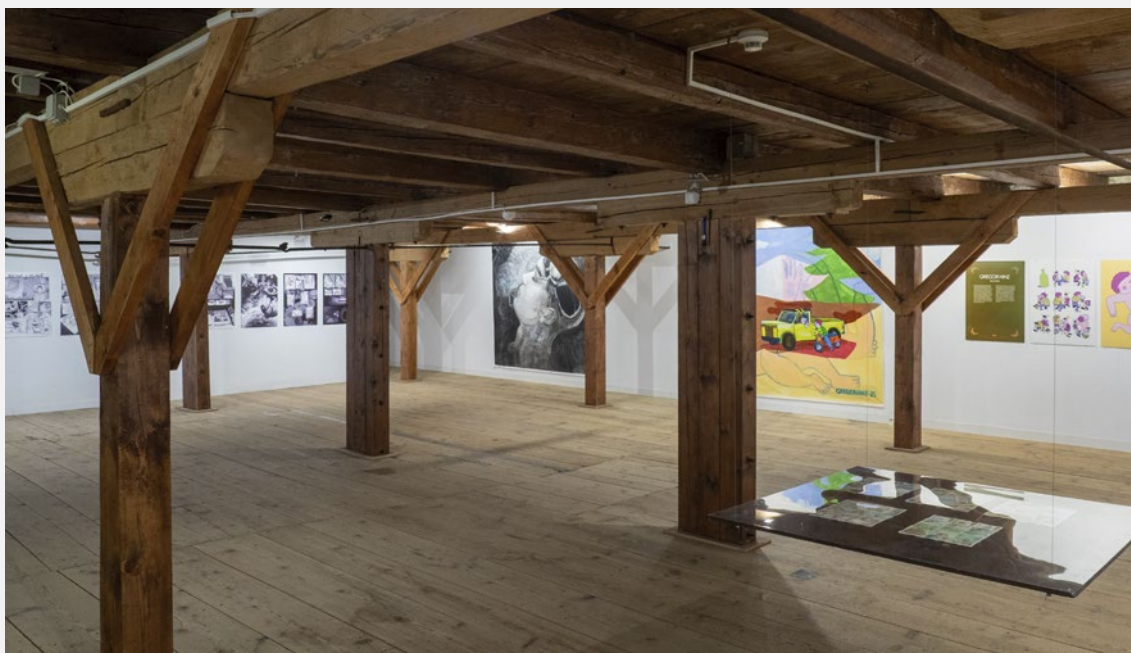
Beze slov, Česko - německé komiksové symposium, pohled do instalace na sýpce v Klenové, foto Jiří Strašek