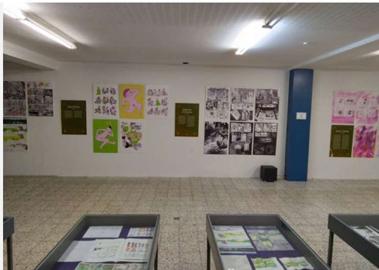
Beze slov, Česko - německé komiksové symposium, pohled do instalace v Zukunftswerkstatt

Kurátoři výstavy: Petra Mazáčová, Václav Šlajch, Michal Lazorčík