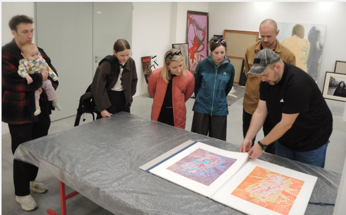
Lino 2025 – 24. symposium linorytu na Klenové

Symposium linorytu dlouhodobě mapuje tento výtvarný obor nejen v Čechách, ale i v okolních zemích. V GKK tak postupně vzniká ojedinělá kolekce linorytů, která je prezentována veřejnosti formou výstav. V roce 2025 proběhl 24. ročník sympózia. (Kurátoři: Michal Lazorčík, Ladislav Sýkora).