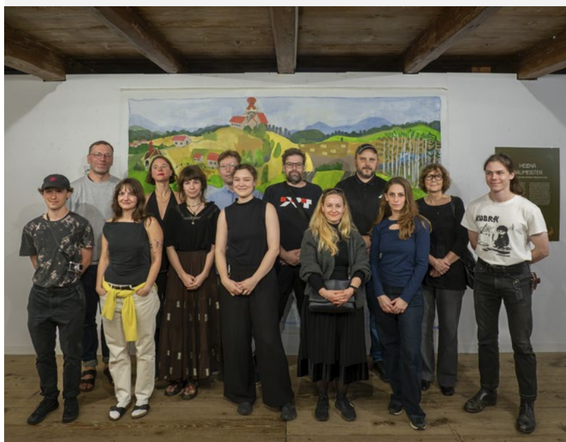
Beze slov, 6 ročník česko-německého komiksového sympózia na Klenové, spolupráce GKK, CEBB, FDU L.S. a Comicm. Erlangen.jpg