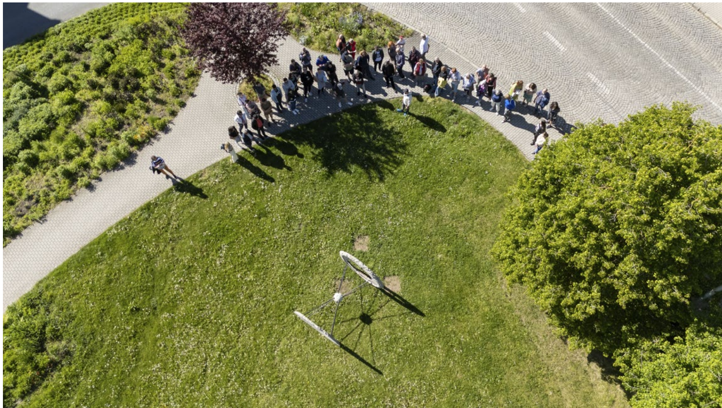
Sochy v ulicích, komentovaná prohlídka výstavy v rámci Muzejní noci 2025, 24.5.2025