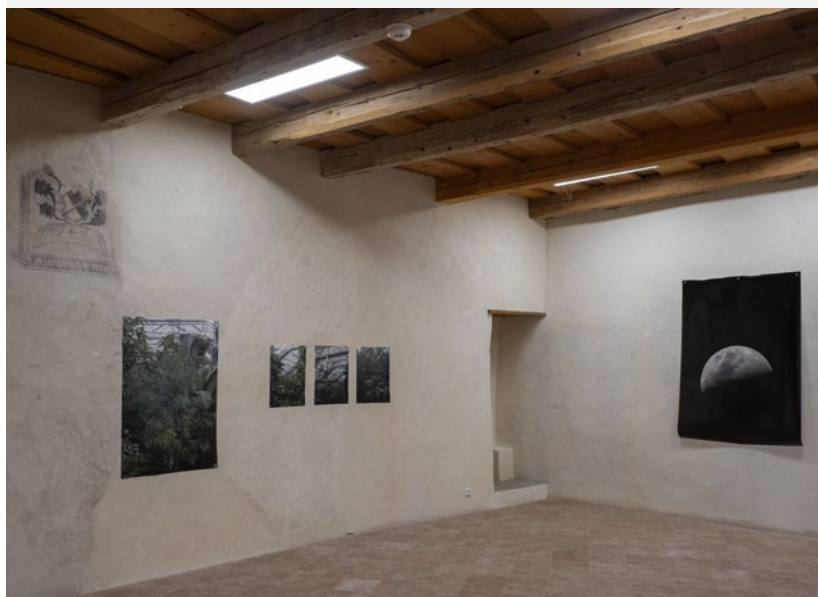
Světlana Malina, Lost Frequencies, purkrabství hradu Klenová, pohled do instalace

Autorka ve své práci dlouhodobě osciluje mezi pozicí vypravěčky a pozorovatelky. Překračuje tradiční rámce vizuálních médií a zkoumá jejich propustnost, jak z hlediska formátu, tak intimní angažovanosti. Výstava mohla být chápána jako návrh, jak se dívat, skrze nejednoznačnost, opakování i ticho, které mezi jednotlivými obrazy zůstává.