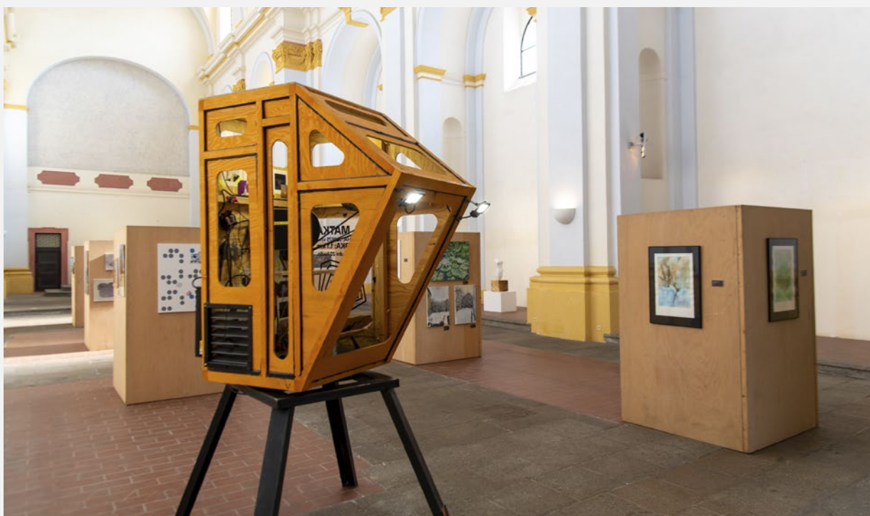
Společné cesty 13, kostel sv. Vavřince, pohled do instalace, foto Jiří Strašek

Kurátoři výstavy: Anjalie Chaubal a Petr Krátký