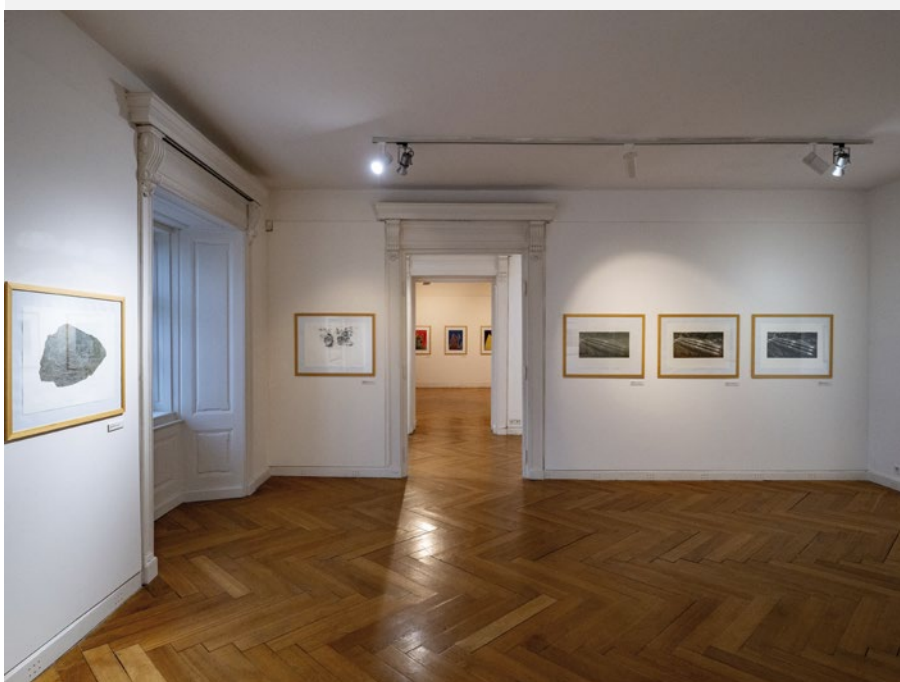
Linoryt III, pohled do instalace na zámku Klenová, foto Jiří Strašek

Od roku 2001 pořádá Galerie Klatovy / Klenová (jako jediná v České republice) téměř každoročně na podzim ve vile Paula na Klenové mezinárodní sympozium linorytu. V roce 2025 proběhl již 24. ročník. Doposud se těchto sympozií zúčastnilo 150 autorů z České republiky, Slovenska, Polska, Německa, Švýcarska, Belgie, Nizozemska, Srbska, Bosny a Hercegoviny, Litvy, Anglie, USA, Austrálie a Japonska. Programové téma nebylo na sympoziu určeno, autoři mohli tvořit volně. Přesto se však mnoho výtvarníků nechalo inspirovat prostředím Klenové – jejím hradem, zámkem nebo okolní přírodou. Výstava Linoryt III. představila práce autorů, kteří se účastnili sympozia mezi lety 2019 až 2024.