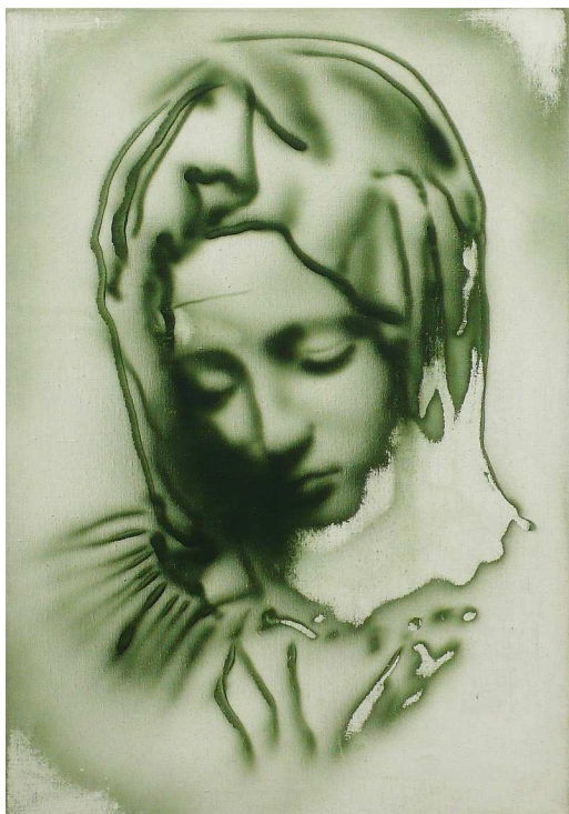
Petr Pastrňák, Bez názvu, 2002