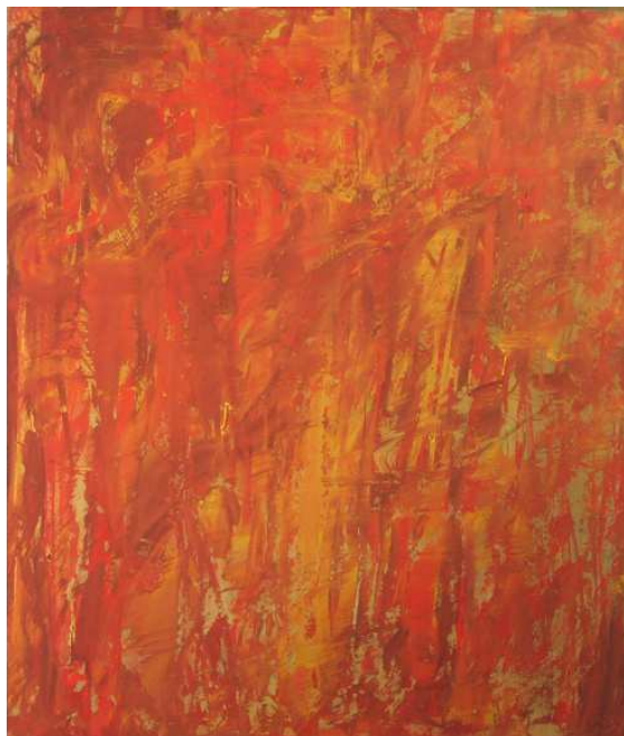
Petr Pastrňák, Požár, 2008