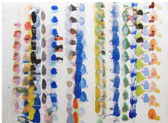
Petr Pastrňák, Bez názvu, 2013