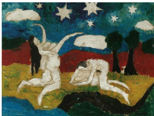
Noční koupání, 1939