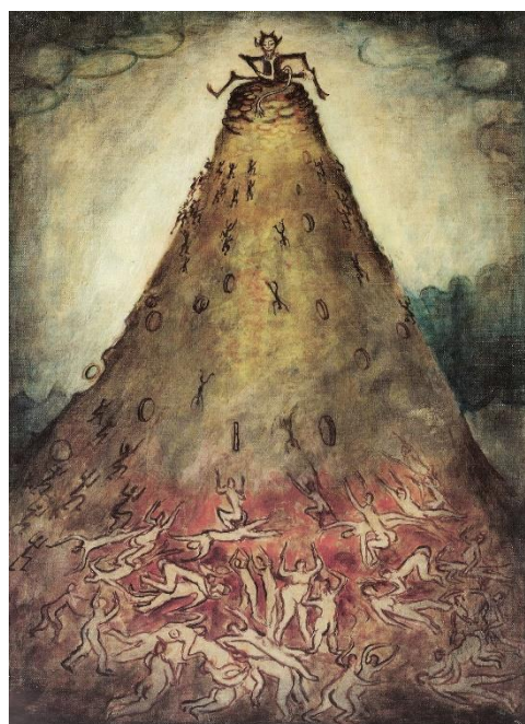
Čertova radost, 1975