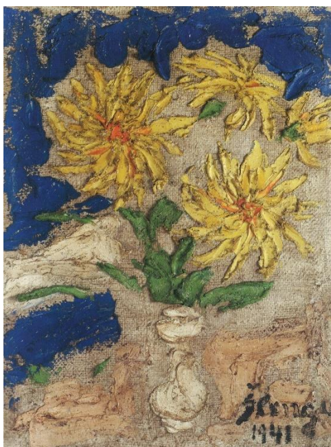
Jiříny I., 1941