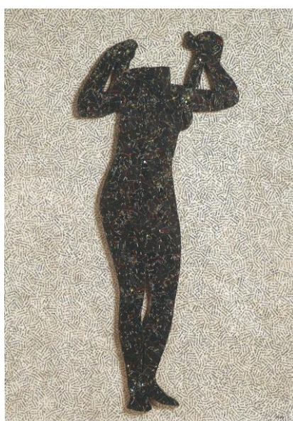
Nikde, 1973, Jiří Kolář