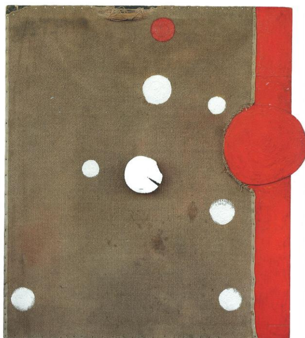
Reklama na nekonečno, 1991, Vladimír Merta