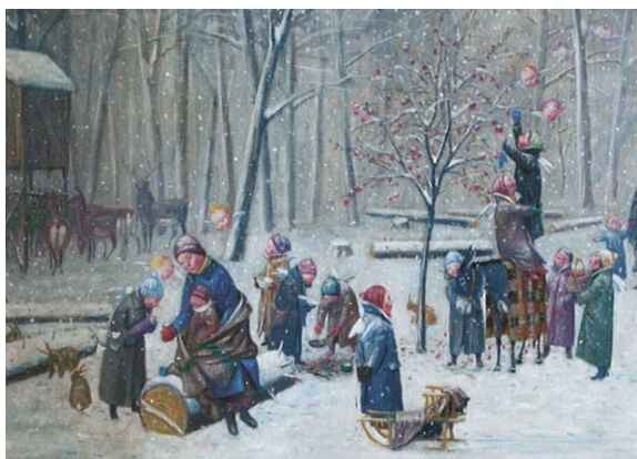
Bez názvu, Jan Knap, 2017

V animačním programu pro nejmenší si na úvod projdeme výstavu. Formou dialogu se děti seznámí s hlavním tématem výstavy – zimními motivy. Budeme si povídat o příbězích, které inspirovaly vybrané obrazy a jejich autory. V praktické části se zaměříme na rozvíjení dětské tvořivosti, jemné motoriky a fantazie. V expozici se zaměříme na 1. patro. Úlohou dětí bude vytvořit zimní krajinu s typickými prvky pro toto období. Vznikne kolektivní dílko, vytvořené na základě vjemů a dojmů z výstavy.