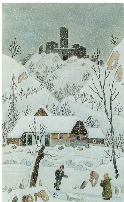
Zima, Josef Lada, 1944

Zima. Období úzkosti, strachu o přežití, ale i odpočinku po zemědělském roce, bilancování a kontempace, dětské radosti z prvního sněhu, naděje Vánoc. Klid a neklid bílé. Jedno téma, různé národnosti, různá období od 19. století po současnost ukáží, že jakkoli v umění panuje různost, je zaklenuto vyšší shodou a obrazy z tolik odlišných dob, prostředí a od tolika a tolik odlišných autorů spolu mohou komunikovat a vypovídat různými uměleckými jazyky v symbolické shodě o jednom.