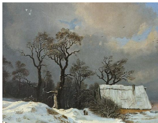
Zimní odpoledne, Berta Grab, 1865