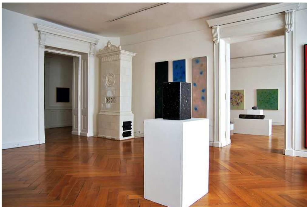
Pohled do instalace výstavy Spříznění volbou / Karl Prantl a Uta Peyrer