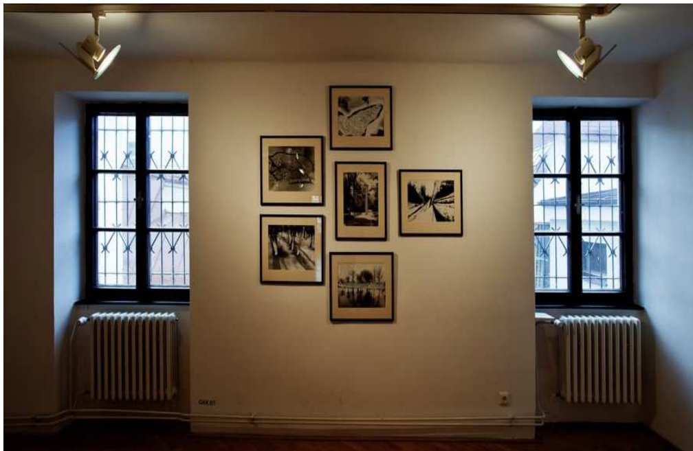
Pohled do instalace výstavy Uchronie / Jiří Valoch – Manipulovaná fotografie