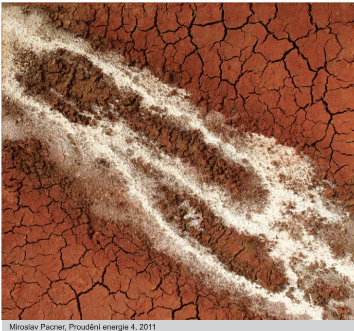
Miroslav Pacner, Proudění energie 4, 2011

Obrazy a reliéfy doplňují fotografie a makety zahrad, parků a veřejných prostorů dokumentující tvorbu v přírodě, která se v posledních letech stává pro autora dominantní.