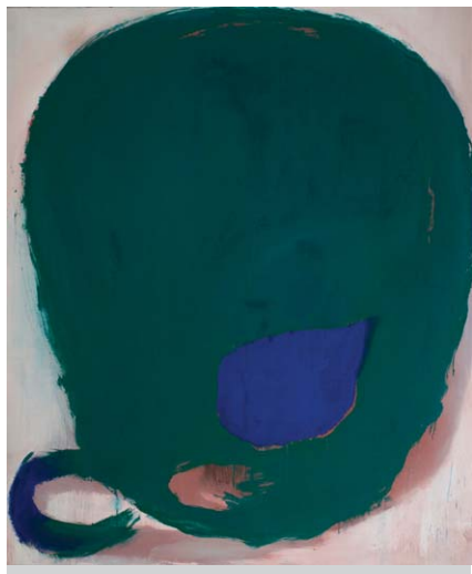
Vladimír Véla, Kostra III, 2012