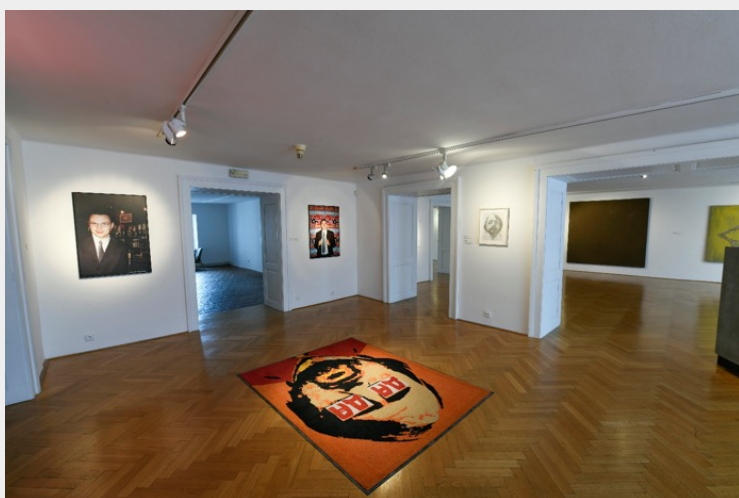
Výstava kARTotéka v Galerii U Bílého jednorozce v Klatovech

Výstavný projekt sledoval možnosti prezentácie zbierkového fondu Galérie Jána Koniarka v Trnave v odlišnom geografickom aj kultúrnom kontexte. Vybrané diela reflektovaly profiláciu zbierkového fondu GJK po roku 1990 – išlo o kurátorský komentár k už existujúcemu zbierkovému fondu. Výber diel sa neobmedzil na konkrétne umelecké médiá, ale ukazoval diverzitu zbierok od maľby, komornej plastiky, konceptuálnej inštalácie, manipulovanej fotografie, či videa. Išlo o autorov, ktorých život a tvorbu do značnej miery determinuje trnavský