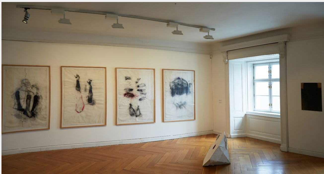
Pohled do výstavy ze sbírek GKK "Všemi směry"