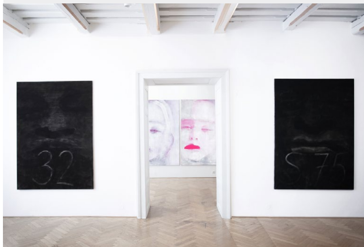
Pohled do výstavy Josefa Žáčka "Disturbances"