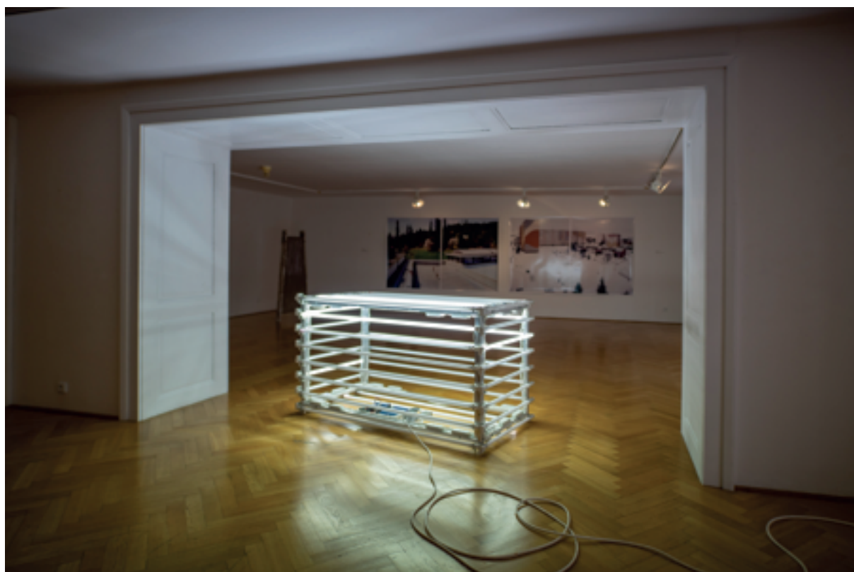
Pohled do instalace výstavy „CITY MEJKAP“

Výstava byla připravena ve spolupráci s Galériou Jána Koniarka v Trnave. Po jejím uvedení v Klatovech byla reprízovaná v Galerii UFFO v Trutnově.