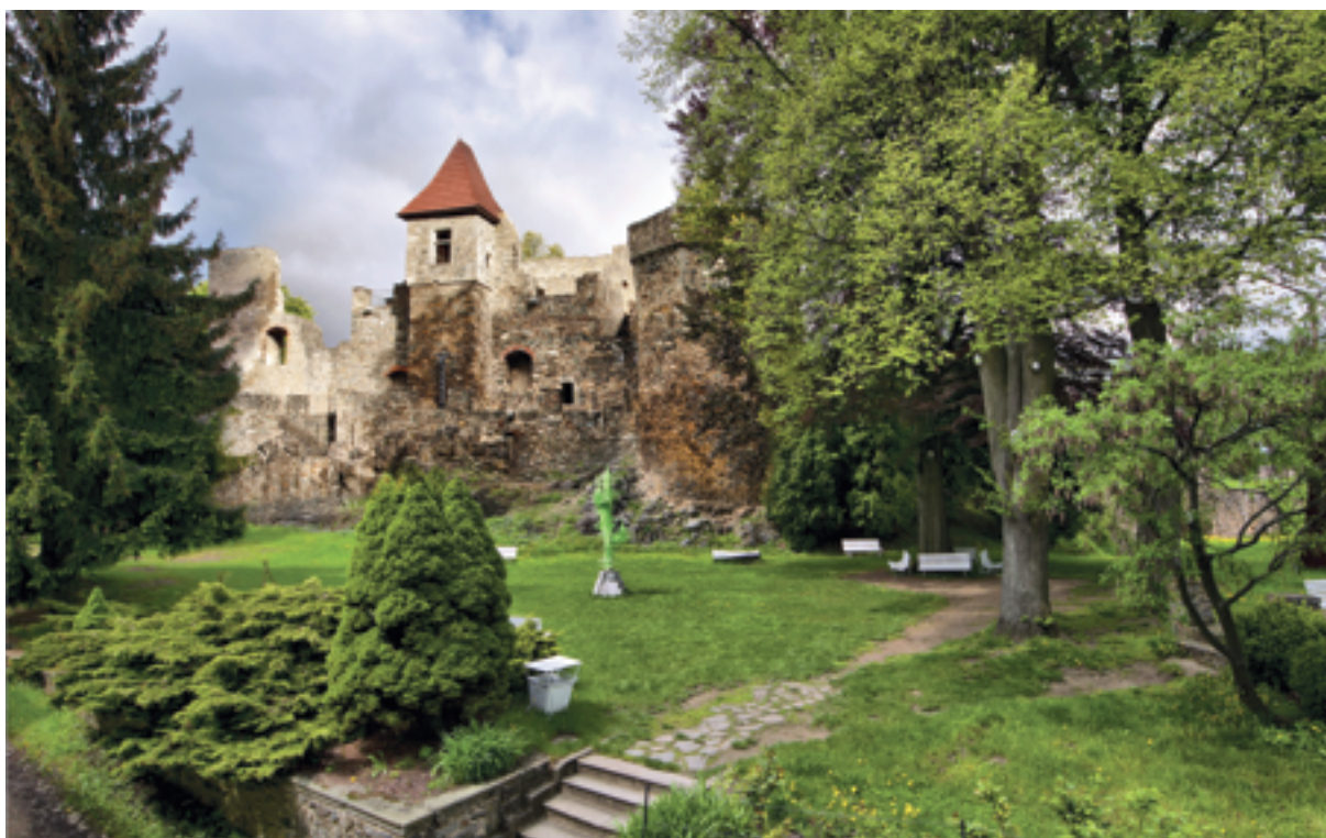
Nádvoří hradu a zámku Klenová

GKK ve svém programu a nabídce klade důraz nejen na prezentaci výtvarného umění ve své pasivní poloze, ale také na aktivní přístup diváka. Připravuje přednášky, komentované prohlídky a hlavně různorodé výtvarné programy pro děti. Kultivuje a vyplňuje tím trávení jejich volného času a předestírá jim nenásilnou formou možný okruh zájmu v budoucnu.