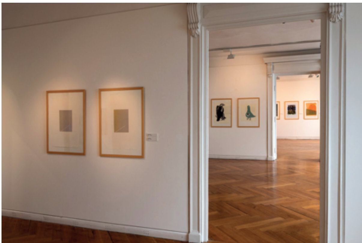
Výstava Linoryt II ve výstavních sálech galerie

V roce 2016 se v galerii na Klenovském zámku konala výstava Linoryt I. V roce 2019 se uskutečnilo její pokračování. Touto výstavou jsme si dali za úkol představit návštěvníkům jednotlivá díla, která nebyla na první výstavě z kapacitních nebo námětových důvodů prezentována. Součástí výstavy byly také grafiky, které vznikly na sympóziích v letech 2016, 2017 a 2018.