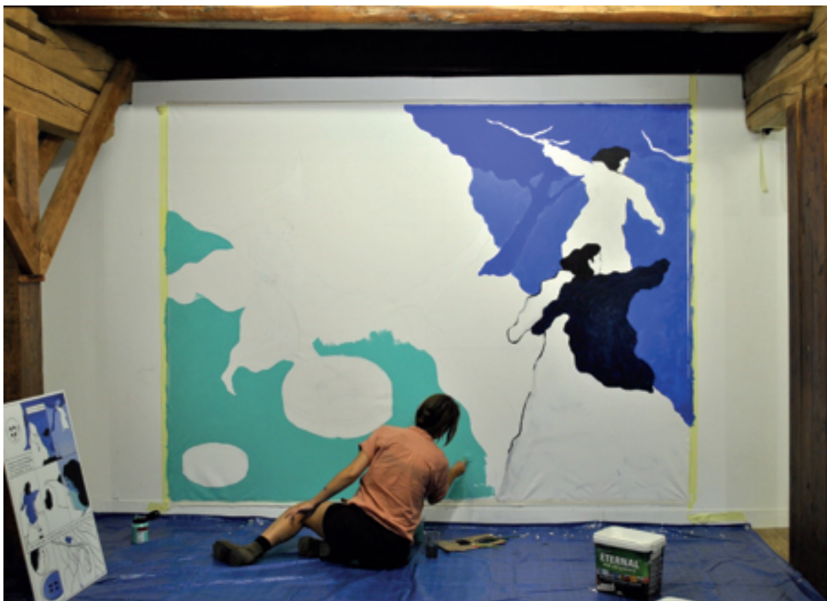
Mezinárodní komiksově sympozium „Faust“