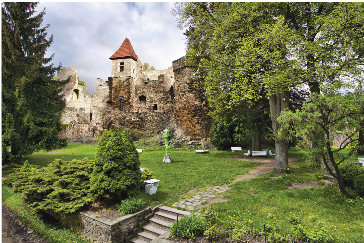
Nádvoří hradu a zámku Klenová

Vedle záměru revitalizace je soustavně tvořen a rozšiřován sochařský park. Areál hradu a zámku poskytuje ideální prostor k trvalému vystavení plastik předních českých i zahraničních výtvarníků a umožňuje tak návštěvníkům vnímat současné umění na pozadí historických budov a romantického plenéru.