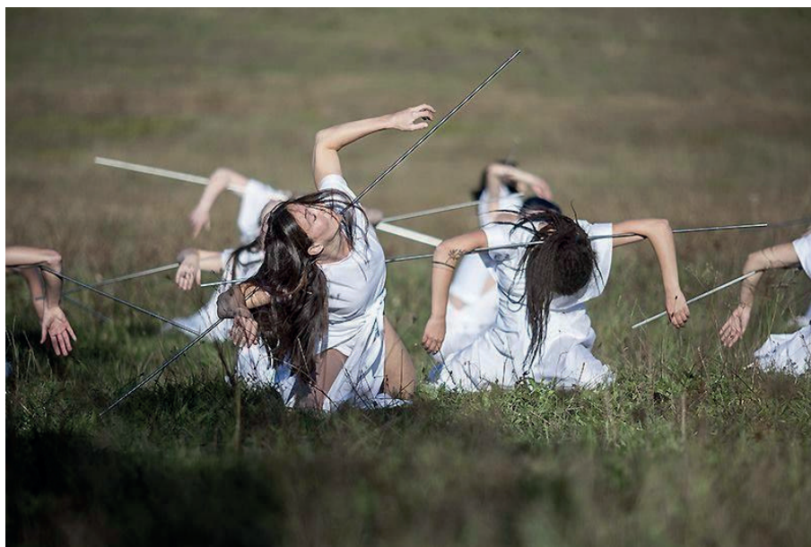
Taneční pouť krajinou na Klenové