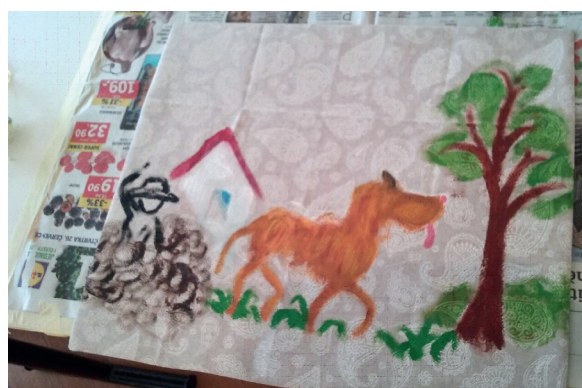
Ilustrační foto z dílen (2018)