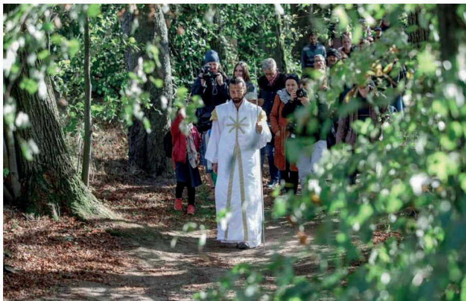
Taneční pouť krajinou na Klenové

Výstup ke kapli a letmý pohled na pohyb odehrávající se uvnitř kontrastoval se soustředěností, k níž vyzývala následující část. Záhora velkoryse využil celou louku, a účastníci tak z velké dálky sledovali několik paralelních akcí odehrávajících se na opačné straně. Chvění suchých kostí z Ezechiela nakonec prostoupilo celým prostorem a tanečníci se skutečně dotkli okamžiku, kdy se k hmotě přidává duch, kdy se neživá matérie nadechuje k životu a kdy je chlad proniknut hřejivou blízkostí a přijetím. Každý z těchto vjemů byl však spoluprožíván s ostatními, stejně jako na společné pouti. A ne každý dokázal na vdechnutí ducha vyčkat přímo na louce. Někteří vstřebávali intenzivní setkání s tancem v autě, kde čekali na zbytek rodiny, která vytrvala.