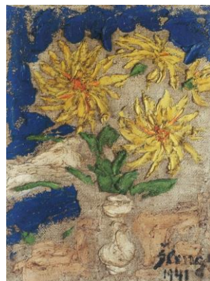
Jiříny I., 1941