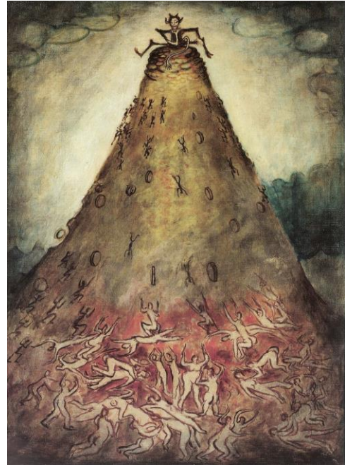
Čertova radost, 1975

V expresivitě však zašel mnohem dál, v strukturách, připomínajících mnohdy již reliéf, zhmotňoval své pocity a stavy, a tak se na počátku 30. let stal ještě před Jeanem Fautrierem anticipátorem informelu. Podobně lze uvažovat nad částí jeho díla v souvislostech s Dubuffetem a Art brut. Šlengrovo dílo má ikonický potenciál přesahující dějiny českého výtvarného umění.