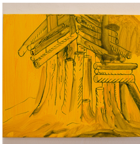
Dům III., 2016