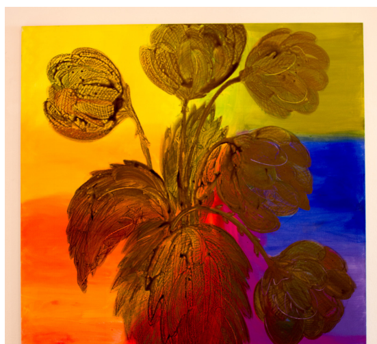
Pivoňka, růže, artyčok, kopřiva, 2015